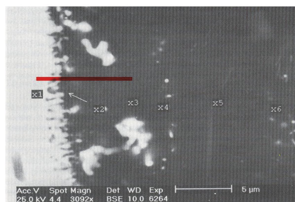
Fer (blanc) – émail (sombre)

L'émail protège les composants contre la corrosion, l'abrasion (usure d'une surface avec enlèvement de matière) et l'incrustation. L'émail est résistant sur le plan chimique, facile à nettoyer (avec tous les produits de nettoyage convenant au verre) et résistant à la chaleur. Les peintures émaillées sont durables et stables à la lumière. L'émail est sensible aux coups.